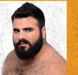
ΗΘΑΙΣΤΟΣ ΠΑΤΡΟΚΛΟΣ, ΚΑΛΕΣΜΕΝΟΣ, ΝΑΥΤΗΣ Β, ΝΑΥΤΑΚΙ,ΠΡΟΒΑΤΟ