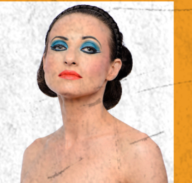
ΑΣΤΕΡΩ ΚΥΤΡΙΑΝΟΥ ΟΚΕΑΝΙΔΑ, ΕΚΑΒΗ, ΠΡΟΒΑΤΟ, ΚΑΛΕΣΜΕΝΟΣ, ΜΟΥΣΑ ΜΠΟΤΙΤΣΕΛΙ